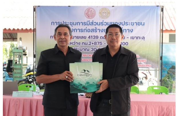
มอบของที่ระลึก โดย ผู้อำนวยการแขวงทางหลวงระนอง