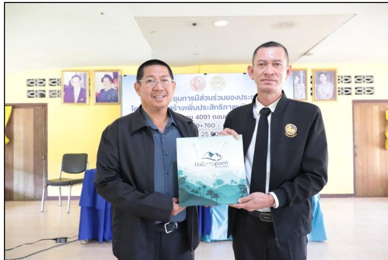
มอบของที่ระลึก โดย ผู้อำนวยการแขวงทางหลวงระนอง